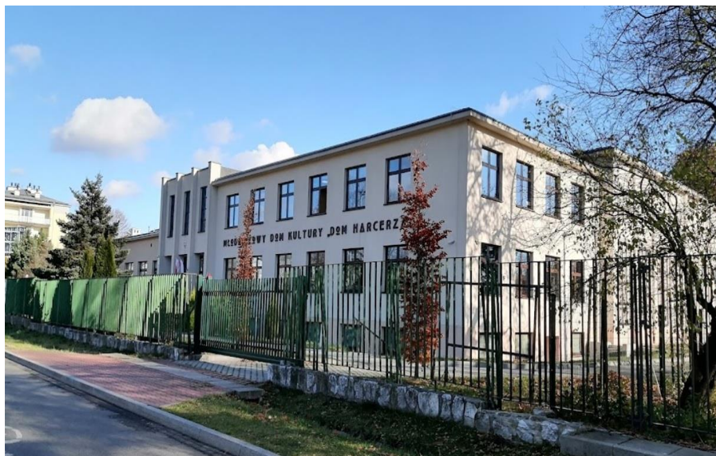
Młodzieżowy Dom Kultury „DOM HARCERZA” ul. Reymonta 18,30-059 Kraków