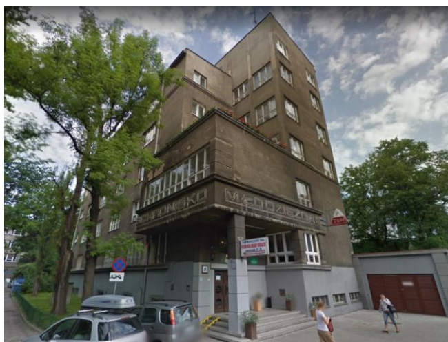
Schronisko Młodzieżowe PTSM "Oleandry" Oleandry 4, 30-061 Kraków